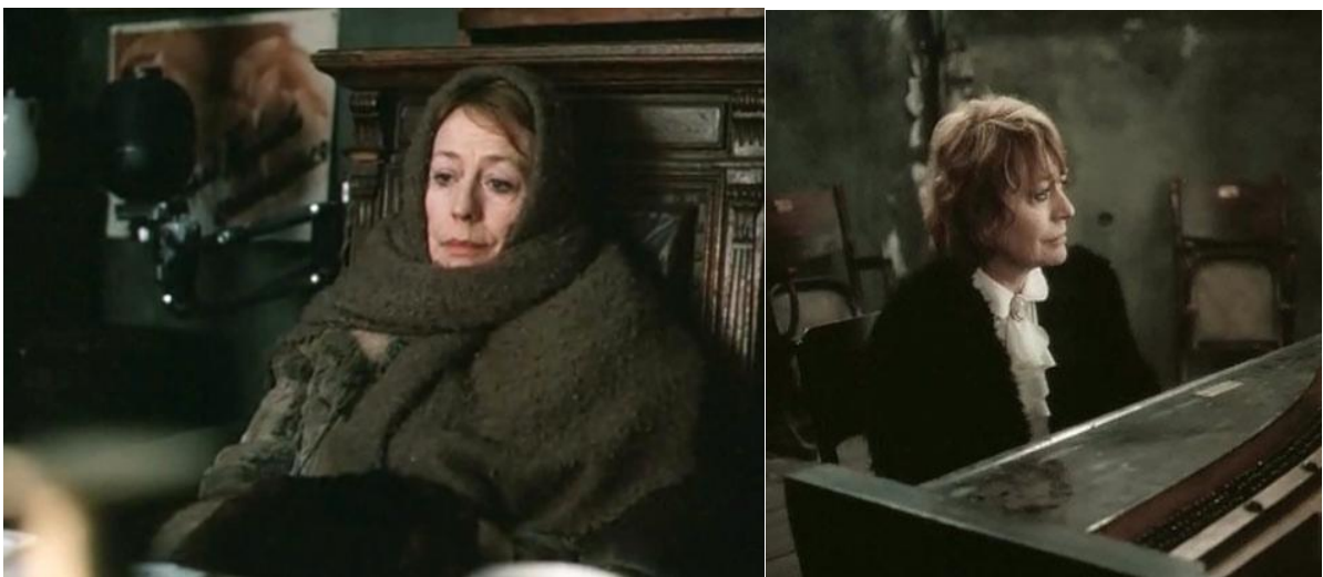
Annie Girardot interprétant le rôle de Véra Lautard dans le film « Ruth » de Valery Akhadov

Les concerts des 20 et 21 septembre, organisées à Cortot et à Nohant par l'association France- Oural, permettront de découvrir les lauréats de la 6 e édition de ce concours.